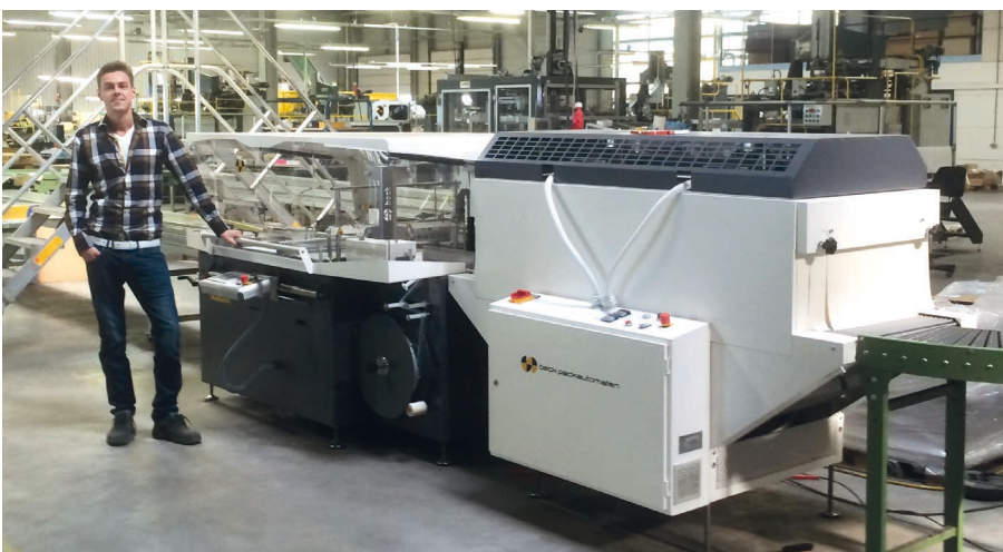
Justin Tettero bij de nieuwe Beck Multiplex MP Pico met HV 601 HPLS krimptunnel.

Bij van Vliet Verpakkingen in Roosendaal is kort geleden een Beck Multiplex MP Pico met HV 601 HPLS krimptunnel geïnstalleerd. Dit productiebedrijf bestaat ruim 25 jaar