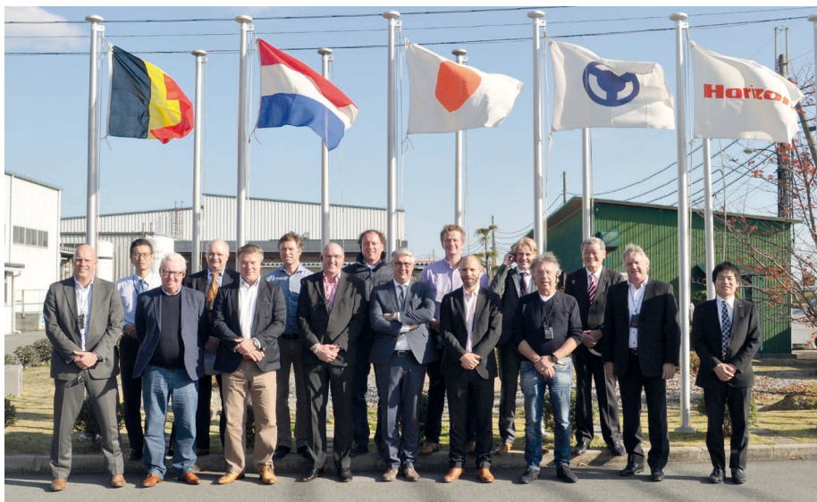
Het Amstel Graphics gezelschap op bezoek bij de Horizon fabriek in Japan.

Eind vorig jaar reisden we met enkele goede Belgische en Nederlandse relaties naar het prachtige Shanghai om daar de beurs All-in-Print-China te bezoeken. Zoals overal in China waren we niet alleen. Nog 62.000 bezoekers waren met ons (ruim 11% meer dan vorig jaar) op dezelfde beurs. Shanghai met 'The Bund' is indrukwekkend, al was het alleen al vanwege de extreme verschillen tussen het oude en het nieuwe China. Via Tokyo reisden we naar Kyoto om de Horizon fabriek te bezoeken. Een indrukwekkende en moderne fabriek waar automatisering in de processen van fabricage van delen